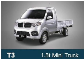
T3 1.5t Mini Truck