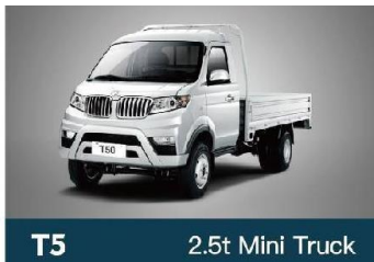
T5 2.5t Mini Truck