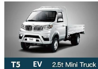
T5 EV 2.5t Mini Truck