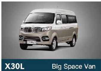
X30L Big Space Van